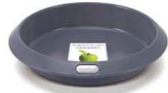
Yuvarlak kek kalıbı, 23 cm