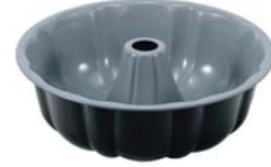
Klasik kek kalıbı, 24*10,5 cm