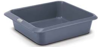
Kare fırın kabı, 23 cm