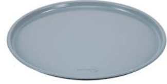
Pizza tepsi, 24*10,5 cm