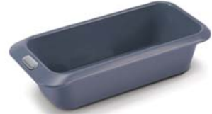
Baton kek kalıbı, 24*10,5 cm